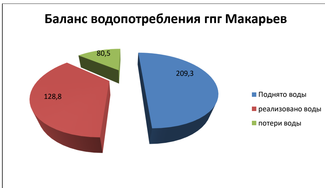
Рисунок - Общий баланс водопотребления городского поселения город Макарьев

Баланс водопотребления ГП г. Макарьев представлен на рисунке .