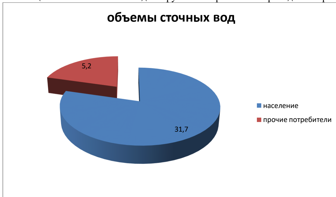
Рисунок - Диаграмма сточных вод по городского поселения город Макарьев

Диаграмма общего баланса сточных вод по группам потребителей приведена на рисунке