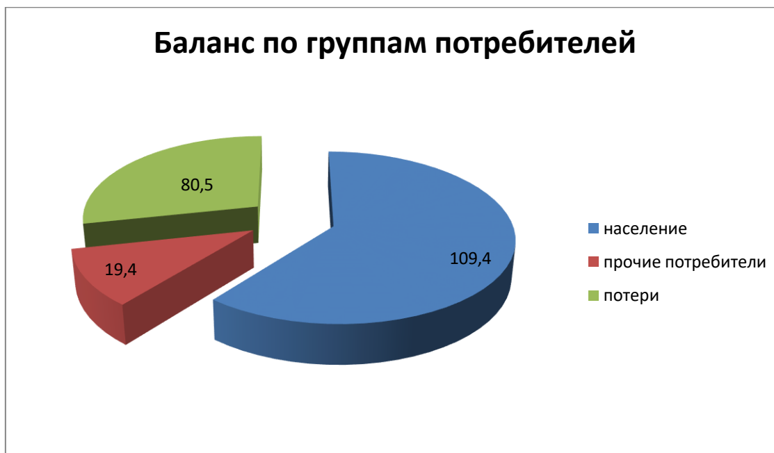
Рисунок - Структурный баланс водопотребления по группам потребителей