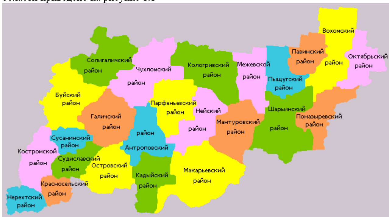
Рисунок 1.1 – Расположение Макарьевского муниципального района на карте Костромской области

Расположение Макарьевского муниципального района на карте Костромской области приведено на рисунке 1.1